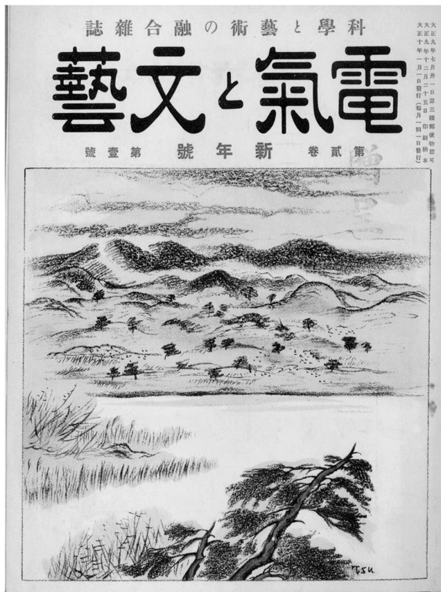
「文学の中の科学的要素」が掲載された 『電気と文芸』第2巻第1号表紙 (大正10年1月、日本近代文学館蔵)

明治23年（1890）～昭和21年（1946）。鹿児島県出身の俳人。本名は杉田久 ひさ 、旧姓赤堀。高浜虚子に師事。『電気と文芸』には創作「河畔に棲みて」「葉鶏頭」「四人室」を寄せている。俳句より小説に力を入れた時期があったのであろう。子供のある家庭婦人が小説や俳句で活躍するのは難しい時代であった。まして地方在住であれば猶更である。師である虚子には言えないことを相談する相手として、寅彦が選ばれたのだから、どちらかというとな保守的な意見しか出なかったのではなかろうか。