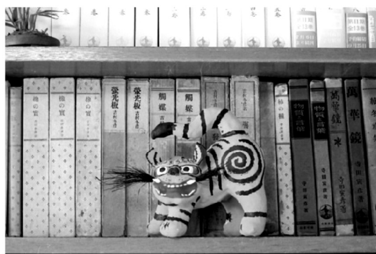
写真：わが家の張子の虎

屋の本棚に張り子の虎を置いている。これは寅彦先生の代りに私を睨んでいる虎である。この張り子の虎を部屋に置きたいと思った要因は、「中谷宇吉郎生誕百年記念 寅彦と宇吉郎の絵画展」の図録で、宇吉郎が張子の虎を描いた軸を見たことであった(この張子の虎の事がどこに書かれていたか忘れてしまい、神田健三さんに教えていただいた)。軸には下の方に張り子の虎が墨で描かれ、上に次のような讚が書かれている。「『僕は怠け者だが、代りの見張りが此処にいるよ』と実験台の上に寅彦先生が残して行かれたのは一匹の張子の虎だっ